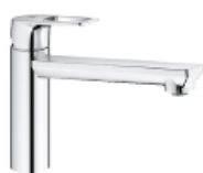
BAULOOP Mitigeur évier Bec médium Réf. 31 708 000