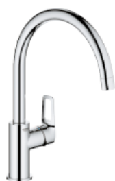
BAULOOP Mitigeur évier Bec haut Réf. 31 388 001